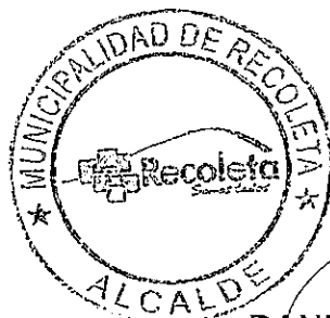
DANIEL JADUE JADUE ALCALDE